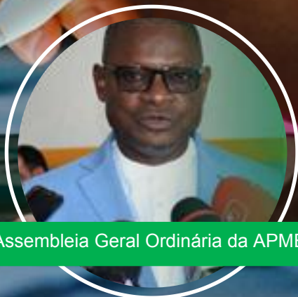
Assembleia Geral Ordinária da APME