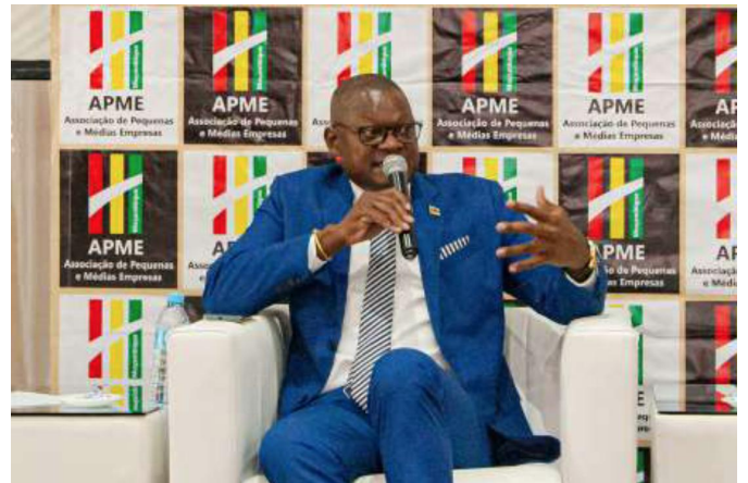
Feito Tudo Male

Conforme reportam os dados do Instituto Nacional de Estatística (INE), devido aos impactos da pandemia viral, a economia moçambicana registou uma contracção em cerca de 1,28% em 2020.