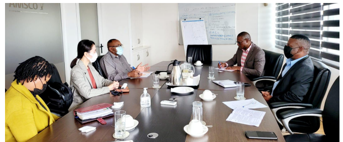
O encontro contou com a presença da equipe do IPEME.

De referir que do numero total de empresas registadas, cerca de 97% são PMEs. Cerca de 5 milhões da população activa, incluindo o sector informal pertencem as PMEs.