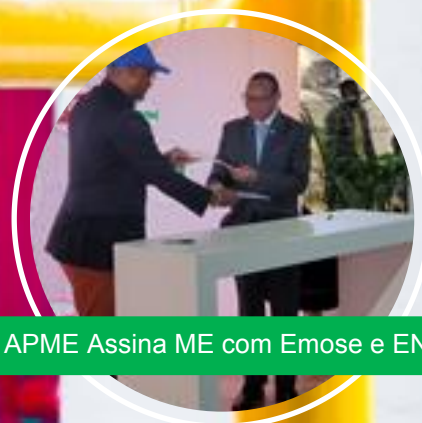
APME Assina ME com Emose e ENPCT