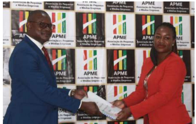
Entrega de instrumentos reguladores às Delegações da APME

O Presidente da APME disse na ocasião que o encontro fora solicitado na sequência da renovação dos órgãos directivos da APME de que resultou o actual elenco que dirige os destinos da agremiação desde Fevereiro de 2021, tendo recordado que uma das prioridades constantes do manifesto que constituiu a base da campanha para a sua eleição é a expansão da representação